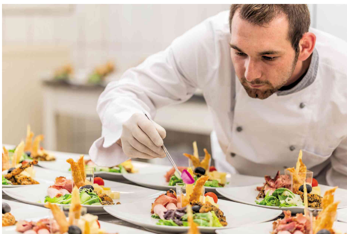
Kuratiert und einzigartig – 12 ausgewählte Gastronomen laden auf eine kulinarische Reise ein

Sie ist aber auch optisch ein Augenschmaus: in einem Schuber befindet sich ein treppenförmiges Podest aus Buchenholz mit eingesteckten Porträtkarten der jeweiligen Restaurants. Darauf erfährt man einiges zur Geschichte, zur Philosophie und zu den Spezialitäten des Hauses. Auf den Rückseiten befinden sich dann die herausnehmbaren Einladungen – mal wird man auf eine Hauptspeise eingeladen, ein anderes Mal erhält man einen Wertgutschein.